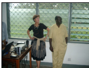
und am Beamer ein Video über Graubünden vorgeführt.