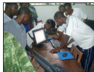
Die Studenten machen ihre ersten Versuche.