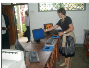
und die Theologische Hochschule ist am WWW .