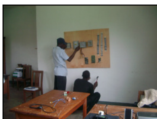
Das Innenleben eines alten PCs dient als Anschauungsmaterial.