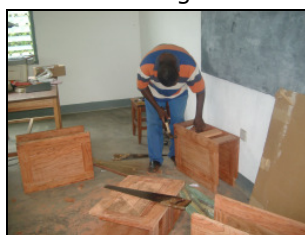
Die Halter für die Zentraleinheit werden vom Schreiner vor Ort erstellt