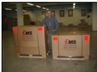
400 kg Hardware sind bereit für den Versand nach Kamerun.