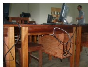
und fachgerecht unter der Tischplatte montiert.