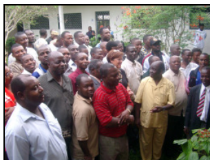
Alle warten gespannt auf die