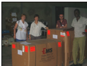
Nach Flug und Verzollung wird die Ware bei Panalpina in Douala abgeholt.