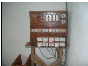
Die Stromversorgung mit Stabilisatoren.