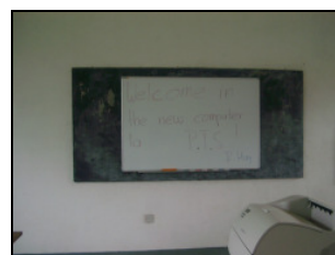
Die neue Magnettafel wurde montiert!