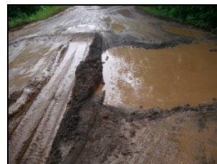
Transport der Ware auf katastrophalen Strassen nach Kumba.